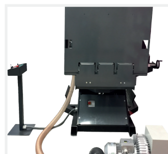
Vue de droite avec pompe