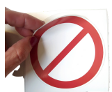
100 x 100 mm

Pack de 1 rouleau 300 étiquettes 100 mm x 100 mm